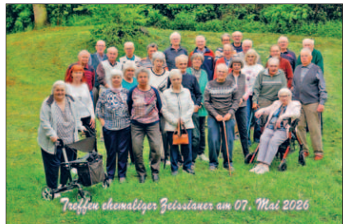
Treffen ehemaliger Zeissianer am 07. Mai 2026