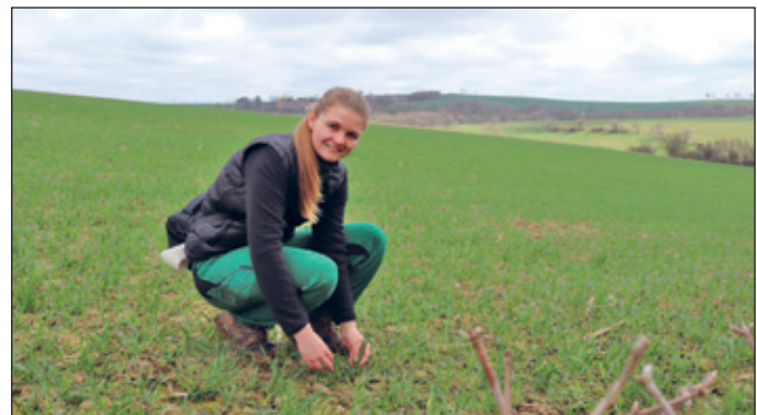
Feldkontrolle im Winterweizen

Bis zur nächsten Ausgabe grüßt Sie, Vroni Koch – www.lwb-koch.de