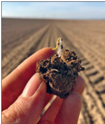
Zuckerrübenkeimling kurz vorm Auflaufen

Bedeutung ist, da es über den Winter wenig Niederschläge gegeben hat und die Reserven im Boden knapp sind. Mit jeder Bearbeitung wird darüber hinaus Luft in den Boden gebracht, was einen Teil des dort eingeschlossenen Kohlenstoffs in CO 2 umwandelt und in die Atmosphäre freisetzt. Außerdem ist Bodenbearbeitung immer sehr kraftaufwändig, was unweigerlich mit hohem Kraftstoffverbrauch einhergeht, den wir aus wirtschaftlichen und klimaschutzrelevanten Gründen auf ein notwendiges Maß begrenzen wollen. Daher überlegen wir genau, welche Maßnahmen wirklich notwendig sind, und variieren mit der Anzahl an Bodenbearbeitungsgängen je nach Zustand des einzelnen Feldes. Der Aufwuchs