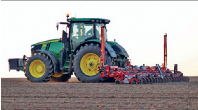
Zuckerrübenaussaat mit Einzelkornsämaschine