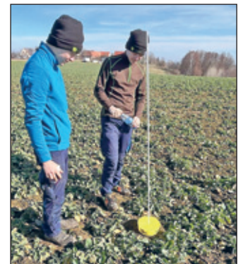
Aufstellen der Gelbschalen (Scott Burkhardt)