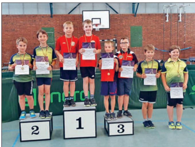
Jungen 11 – Doppel