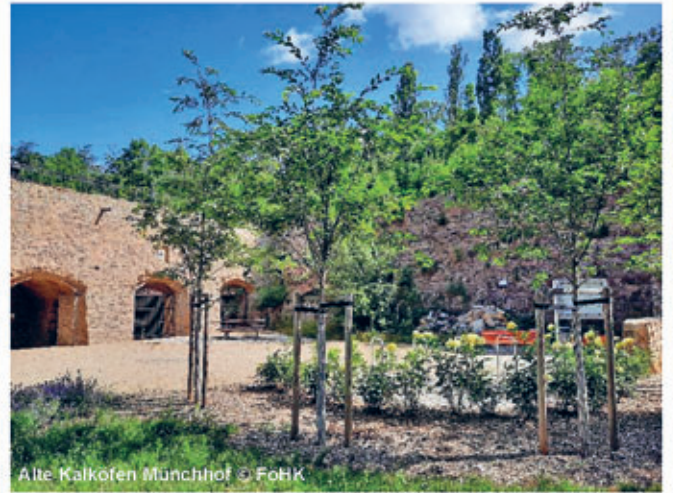
Alte Kalköfen Münchhof

In Ostrau gibt es am Jahnatalweg eine weitere Einkehrmöglichkeit, die Bauernstube. Der neu gestaltete Rastplatz Eschkemühle im Zentrum Ostraus mit Wassertret- und Abenteuerspielplatz ist ein idealer Ort zum Verweilen und Sammeln eines weiteren Stempels der Entdeckertour ein. Dank einer Bürgerinitiative steht unweit das Kulturdenkmal Gasthof „Wilder Mann“ mit einem einzigartigen spätklassizistischen Ball- und Festsaal wieder für zahlreiche Veranstaltungen zur Verfügung.