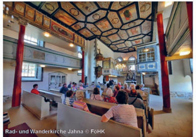
Rad- und Wanderkirche Jahnatal

In Ostrau gibt es am Jahnatalweg eine weitere Einkehrmöglichkeit, die Bauernstube. Der neu gestaltete Rastplatz Eschkemühle im Zentrum Ostraus mit Wassertret- und Abenteuerspielplatz ist ein idealer Ort zum Verweilen und Sammeln eines weiteren Stempels der Entdeckertour ein. Dank einer Bürgerinitiative steht unweit das Kulturdenkmal Gasthof „Wilder Mann“ mit einem einzigartigen spätklassizistischen Ball- und Festsaal wieder für zahlreiche Veranstaltungen zur Verfügung.