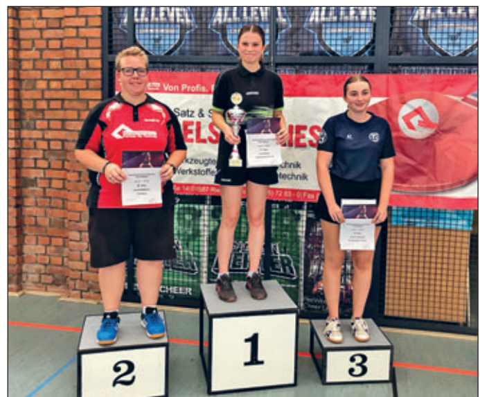
Damen – Einzel