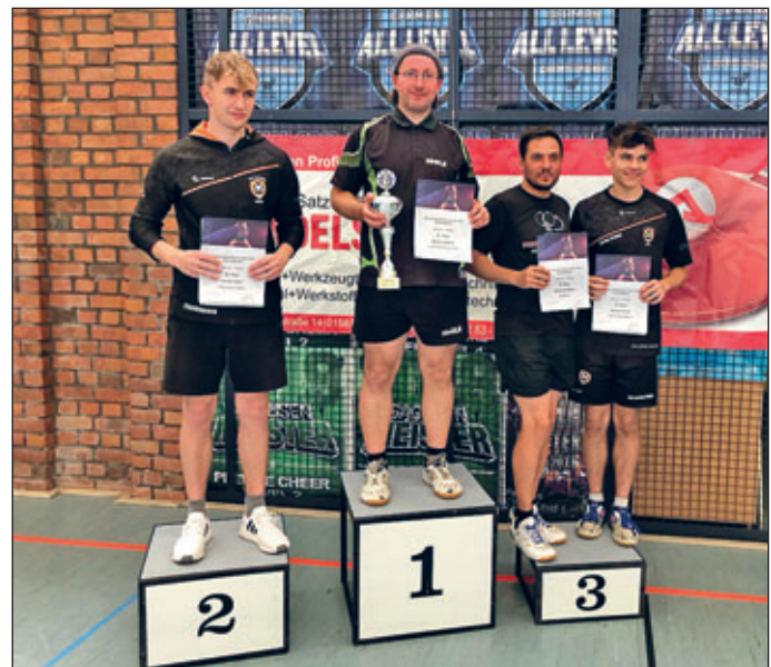
Herren – Einzel