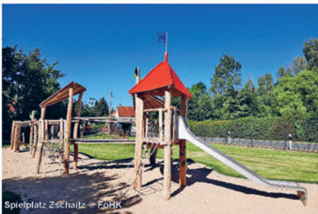
Spielplatz Zschaitz

2023 fusionierten Ostrau und Zschaitz zur Gemeinde Jahnatal. Der idyllische Jahnatalweg führt wie ein grünes Band durch die Gemeinde. Rund um den Burgberg in Zschaitz befindet sich direkt am Jahnatalweg mit dem Naherholungszentrum ein Rastplatz für Erholung, Sport und Spaß, u.a. mit Trimm-Dich-Pfad, Freiluftschach und neu gestaltetem Spielplatz. Im Sommer veranstaltet der Heimatverein hier Freiluftkinoabende. Vom slawischen Burgberg eröffnet sich ein wunderbarer Blick in die Umgebung. Natürlich steht am Naherholungszentrum auch einer unserer Stempelkästen von GERSTINs Entdeckertour. Der Gasthof in Zschaitz lädt mit familiärer Gastlichkeit zu einem Stopp ein. Weiter führt der Weg weiter nach Ostrau. Unterwegs lohnt sich ein kleiner Abstecher im Ortsteil Münchhof zum restaurierten Kalkofen mit Aussichtsplattform.