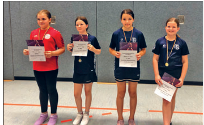
Mädchen 13 – Doppel