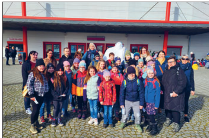
Die Klasse 3a der Grundschule "Lommatzcher Pflege"

Dem netten Busfahrer, der uns zur Sachsenarena Riesa gefahren hat, rufen wir ebenfalls noch einmal ein dickes "Dankeschön" zu!!