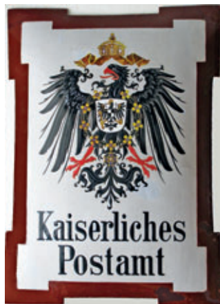
Kaiserliches Posthauschild in der Schleinitzer Museums-Poststube