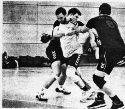
Männer: SSV Lommatzsch – ESV Dresden II 22 : 24 (14:12)