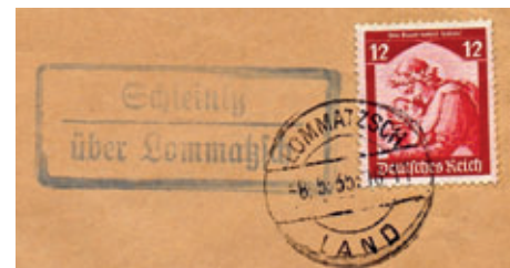
Schleinitzer Landpoststempel und Tagesstempel von Lommatzsch aus früheren Zeiten