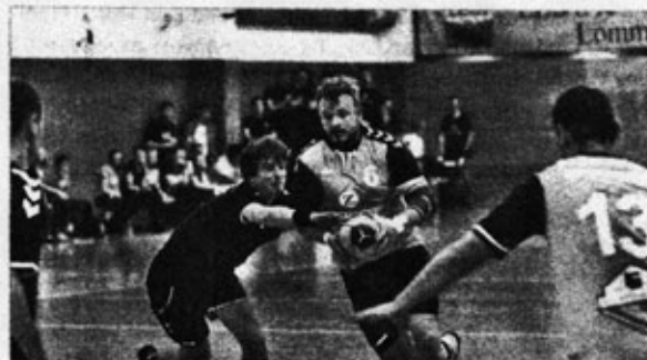
Männer: SSV Lommatzsch – ESV Dresden 2 31 : 23 (19:12) 7.4.18