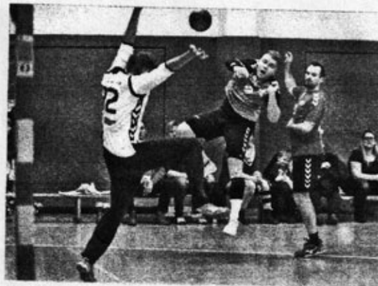
Bezirksliga Männer: SSV Lommatzsch - HSV Dresden II 24:32