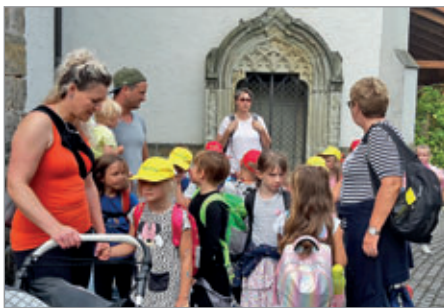
Die Kinder der Vorschule in Lommatzsch

Olympia hinabgleiten konnten. Auch das war geschafft. Nun wurde es richtig abenteuerlich. Da stand doch am Spielplatz ein geheimnisvoller Turm. Und wie sich später herausstellte, handelte es sich um den berühmten Hungerturm. Zum Glück waren wir heute ganz brav und hatten damit nicht ernsthaft etwas zu befürchten. Vorsichtig tasteten wir ins in das dunkle Verlies vor. So gruslig war es dann doch nicht. Den Turm führte eine Treppe hinauf und an der Wand befand sich eine mittelalterliche Wasserleitung. Sehr interessant. Vom Turm aus weiter führte die „Lügenbrücke“ hin zum Museum und Kräutergarten. Unsicher betraten wir die Brücke, das eine oder andere Mal hatten wir schon geschwindelt. Puh, nicht geknarrt, wahrscheinlich doch kaputt. Im Museum angelangt gab es viel zu bestaunen. Besonders hatten es uns die Stabheuschrecken angetan. Ein Modell der Elbe von der Quelle bis zur Mündung faszinierte uns. Der nächste Höhepunkt war die Fahrt mit der Stadtbahn, die uns doch tatsächlich genau vor der Eisdielen absetzte. Nach dieser leckeren Stärkung wanderten wir zum Puschkinplatz und fuhren von dort aus zurück. Sichtlich erschöpft, mangels Mittagsschlaf, und nach einem kurzen Fußmarsch kamen wir wieder in der Vorschule an. Ein toller Tag ging zu Ende.