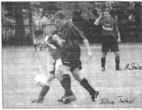
Spielszene aus der zweiten Halbzeit: In der Partie Lommatzsch gegen Hellerau-Hellerau.

Beleuchtet man den fußballerischen Weg des LSV nach dem Jahre 2000 so könnt man oberflächlich denken: „Fahrstuhlmannschaft!“. Doch dem ist bei Weitem nicht so, ganz im Gegenteil!