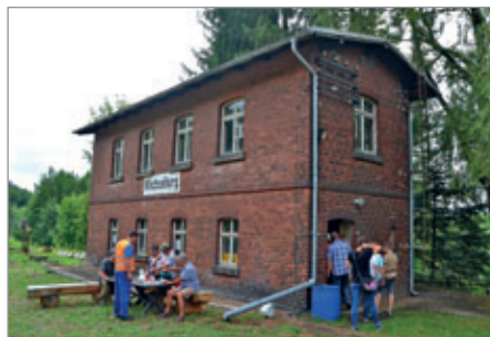
Stellwerksbesichtigung in Wechselburg