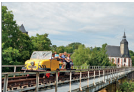
Auf der Muldenbrücke in Rochlitz

Halt in Wechselburg, Ankunft in Amerika und die Göhrener Brücke bei der Rückfahrt.