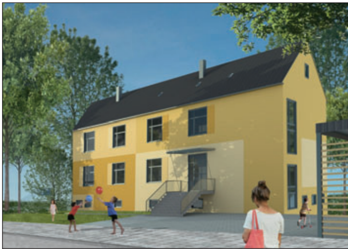
(Modell für künftige Nutzungsmöglichkeit)

Stadt Lommatzsch bietet öffentlich das Grundstück in Lommatzsch, Domselwitzer Gäßchen 4, (Flurstück 768/13 Gemarkung Lommatzsch, 5.017 m 2 ) zum Kauf an. Das Grundstück ist bebaut mit einem derzeit leerstehenden ehemaligen Bürgerhaus/ehemalige Berufsschule. Die Nutzfläche des bestehenden Gebäudes beträgt 470 m 2 und die Brutto-Grundfläche (BGF) 862 m 2 . Der Grund und Boden ist aufgeteilt in Wohnbaufläche, Freizeit- und Erholungsfläche und in ein Biotop.