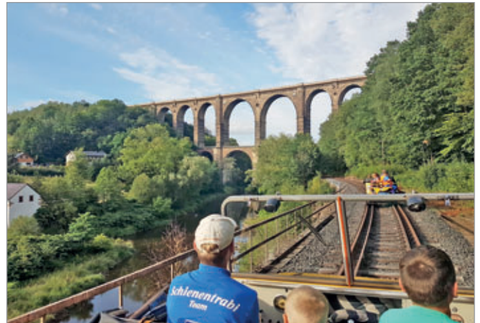
Am Göhrener Viadukt

Die Bilder zeigen den Beginn der Fahrt über die Muldenbrücke in Rochlitz, Stellwerksbesichtigung in Wechselburg