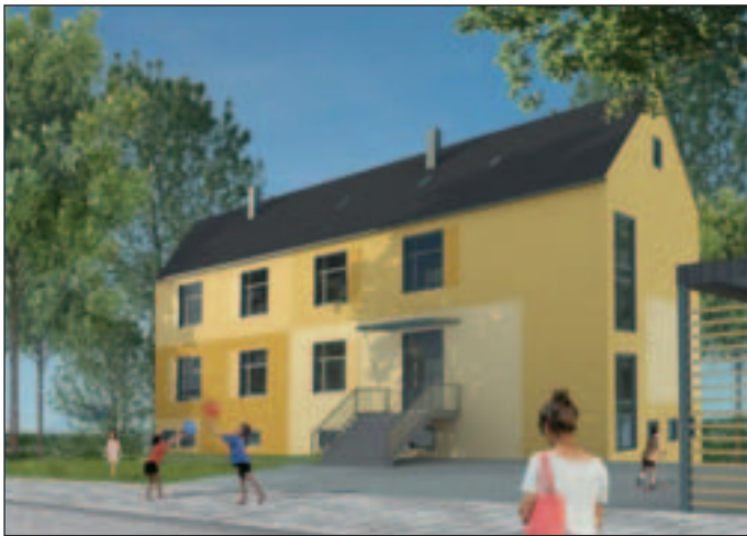
(Modell für künftige Nutzungsmöglichkeit)

Die Stadt Lommatzsch hat bereits ein Projekt zur wohnwirtschaftlichen Nutzung erarbeiten lassen.